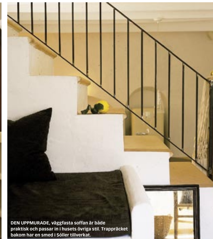
DEN UPPMURADE, väggfasta soffan är både praktisk och passar in i husets övriga stil. Trappträcket bakom har en smed i Söller tillverkat.